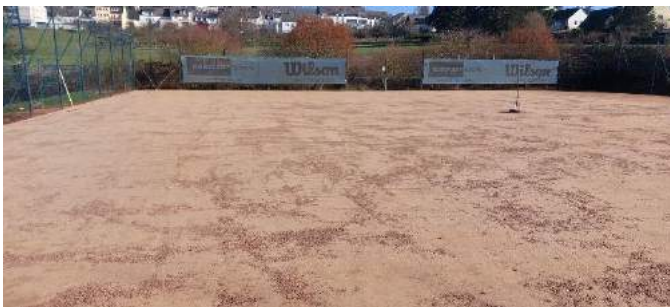
Feinausgleich mit Mineralsand