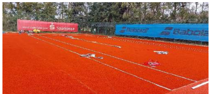
Beginn Verlegungsarbeiten Kunstrasen