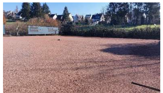
Dynamische Schicht (tragfähig + wasserdurchlässig)