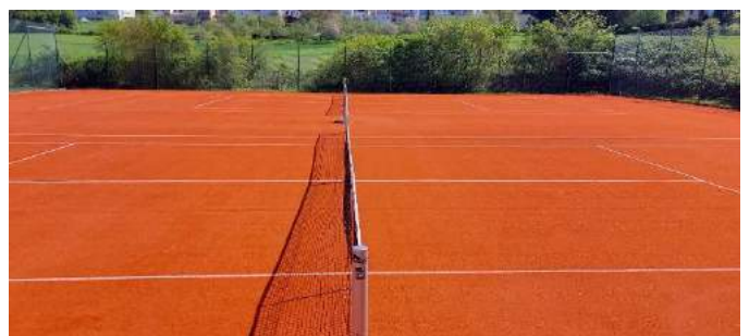
Fertigstellung mit Keramiksand und Netzanlage