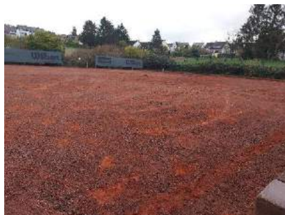
Grobplanie bestehende Belagsschicht