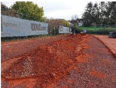
Abtrag der alten Ziegelmehldecke

Nach über 30 Jahren Nutzung haben wir unsere drei Tennisaußenplätze in diesem Jahr saniert. Hierbei haben wir uns für ganzjährig bespielbare, nachhaltige (u.a. ohne Wasserverbrauch) und multifunktional nutzbare Kunstrasenplätze entschieden. Hinzu kamen diverse Optimierungen im Bereich der Zuschauer-/ Gemeinschaftsfläche und um die Tennisanlage herum. Das mit viel Eigenarbeit gestemte Vereinsprojekt umfasste ein Investitionsvolumen von fast 150.000 €!